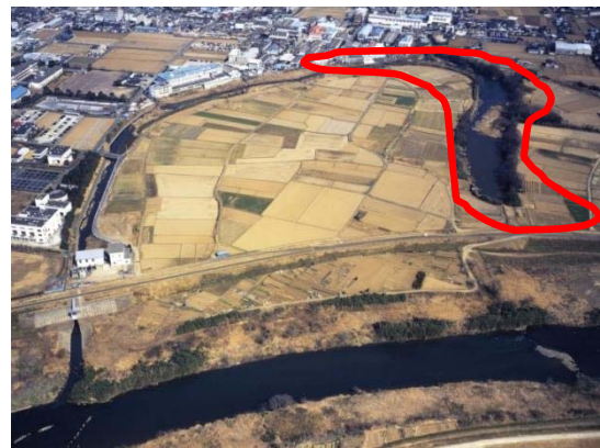
今回の活動（散策）予定地