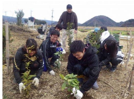
エノキ・ムクノキ等の苗木の植樹