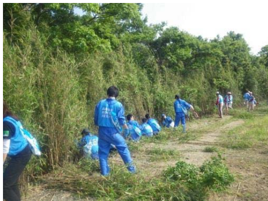
竹伐採・清掃活動